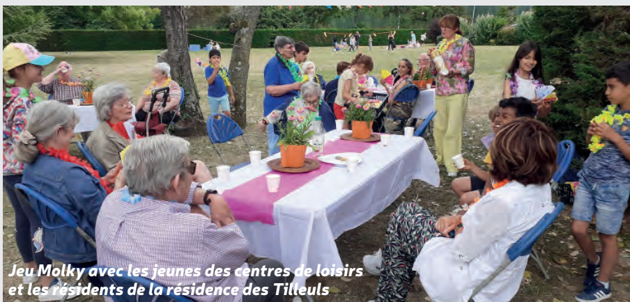
Jeu Molky avec les jeunes des centres de loisirs et les résidents de la résidence des Tilleuls