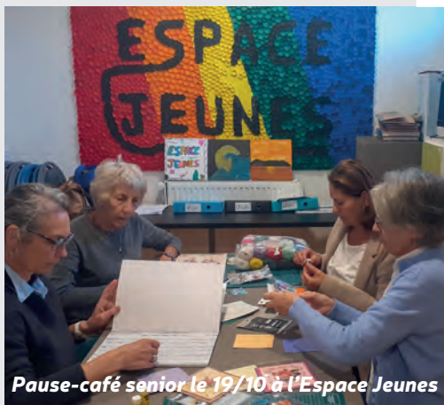
Pause-café senior le 19/10 à l'Espace Jeunes