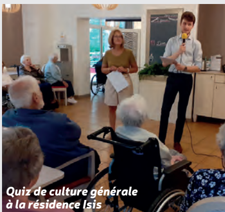
Quiz de culture générale à la résidence Isis