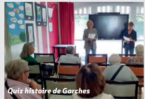
Quizz histoire de Garches