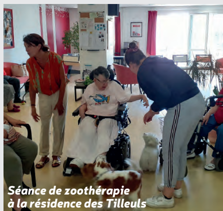
Séance de zoothérapie à la résidence des Tilleuls