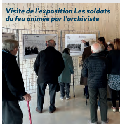
Visite de l'exposition Les soldats du feu animée par l'archiviste