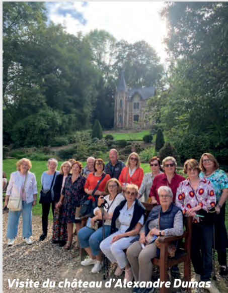
Visite du château d'Alexandre Dumas