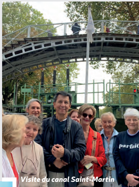
Visite du canal Saint-Martin