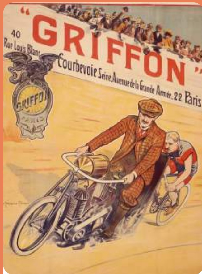
"GRIFFON" Vers 1910 Louis Trinquier-Trianon Nanterre, Archives départementales des Hauts-de-Seine