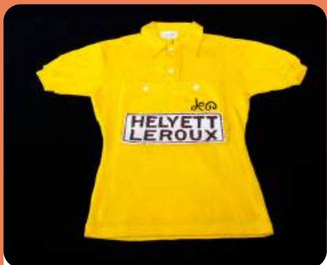
Maillot jaune porté lors des trois étapes du Tour de France 1959 par Michel Vermeulin, membre de l'équipe Helyett-Leroux 1959 Attribué au Coq Sportif Collection particulière