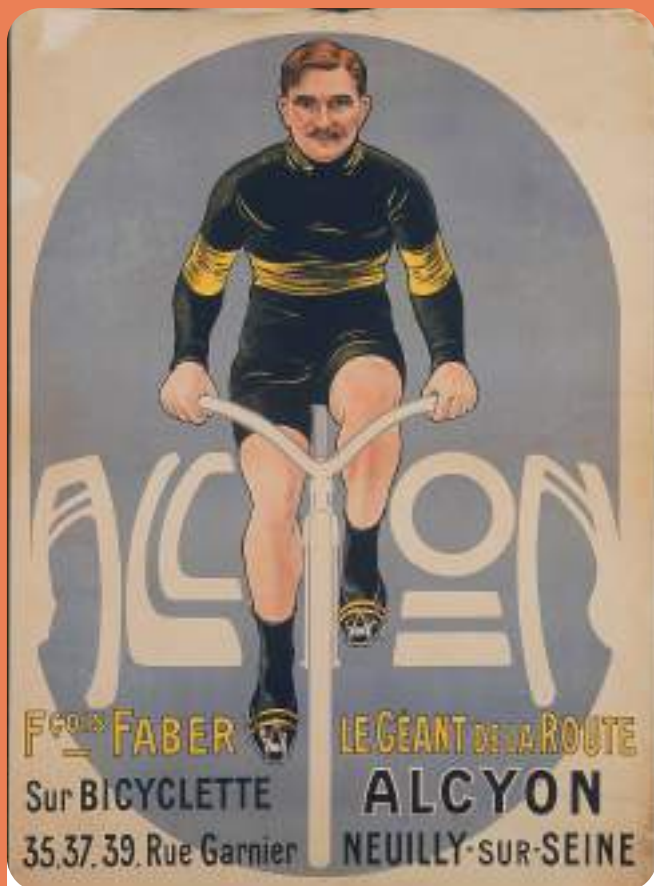
François Faber, Le Géant de la Route sur bicyclette Alcyon vers 1909 Anonyme, ALCYON. Sceaux, Château de Sceaux, musée départemental