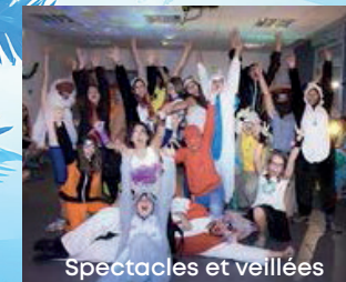
Spectacles et veillées