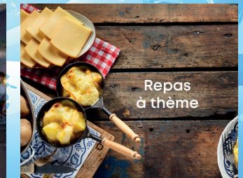
Repas à thème